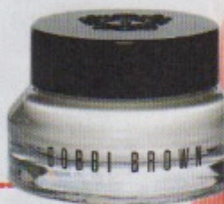
Bobbi Brown Hydrate Eye Cream (€ 40, www.bobbibrowncos- metics.com)