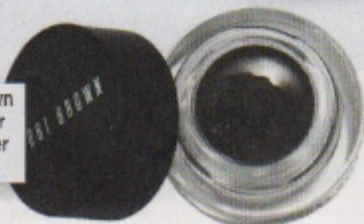
Bobbi Brown Long Wear Gel Eyeliner (€ 23,50)