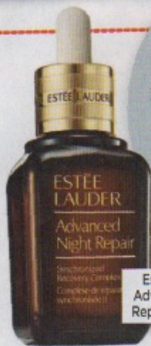
Estée Lauder Advanced Night Repair (€ 112,76)

'Ik kan niet zonder de oogcrème van Bobbi Brown: het is een superproduct om er meteen wakker uit te zien. 's Avonds gebruik ik dan weer Advanced Night Repair van Estée Lauder: een wondermiddel voor je huid. Het serum is redelijk duur, maar gelukkig doe ik een jaar met één flesje, waardoor ik het altijd opnieuw op m'n wishlist kan zetten met de feestdagen. En dan is er nog mijn favo parfum Zen van Shiseido: het enige parfum waar ik niet misselijk van word of hoofdpijn van krijg.'