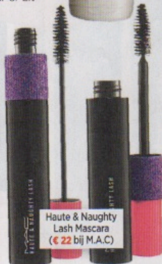
Haute & Naughty Lash Mascara (€ 22 bij M.A.C)