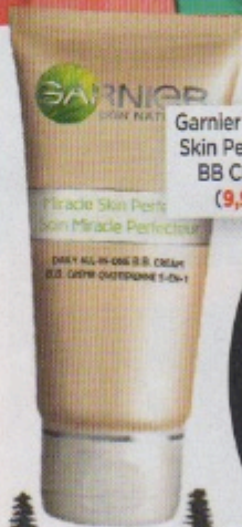
Garnier Miracle Skin Perfector BB Cream (9,99)